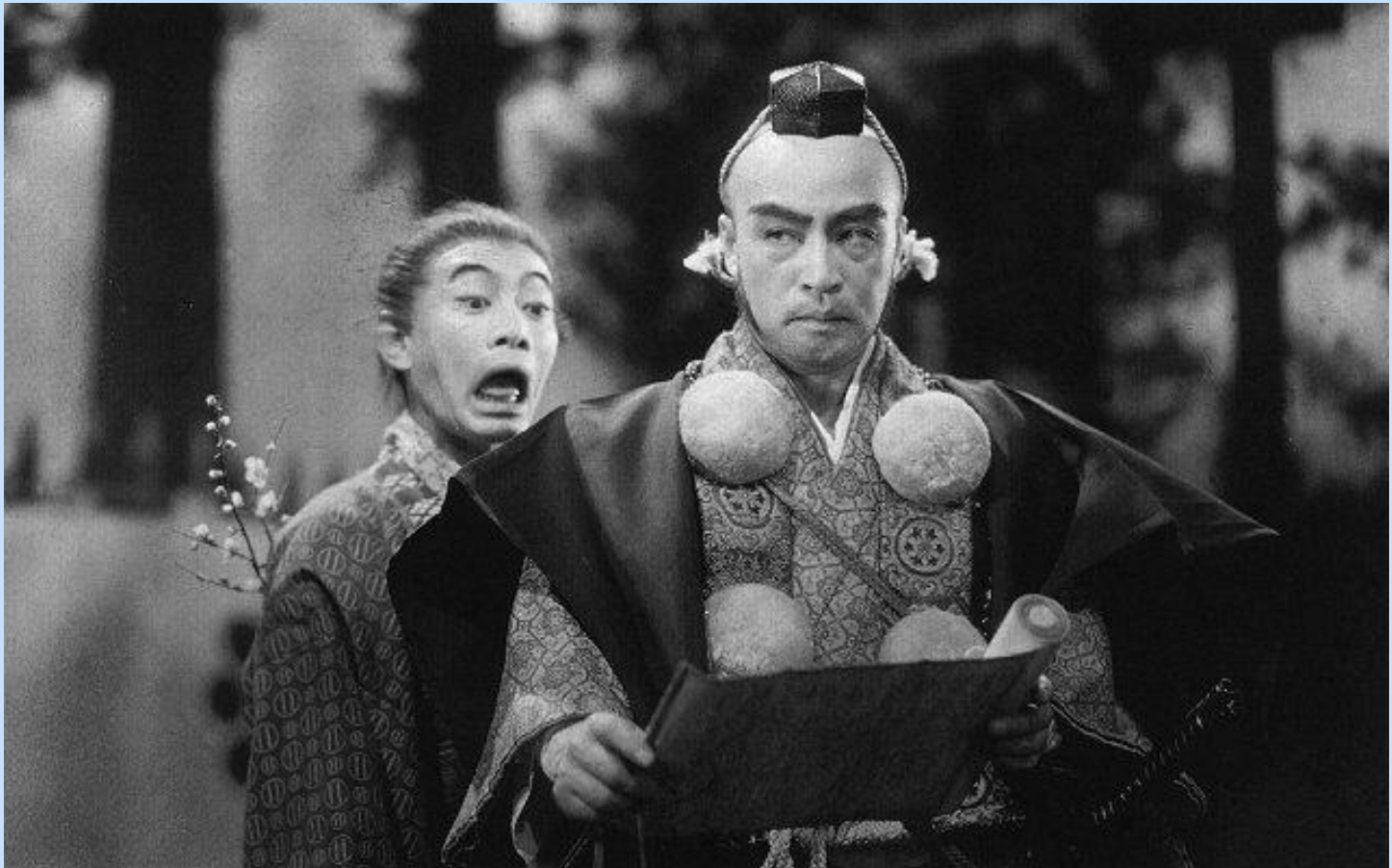
Los hombres que caminan sobre la cola del tigre Akira Kurosawa (1945)