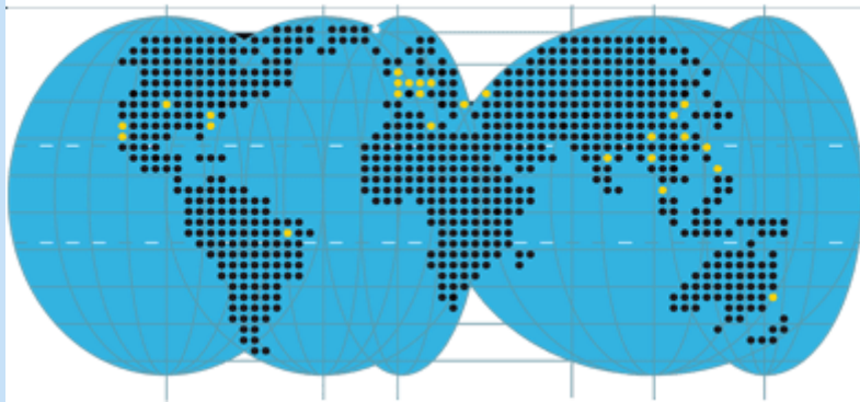
Oficines de Jiji a l'estranger