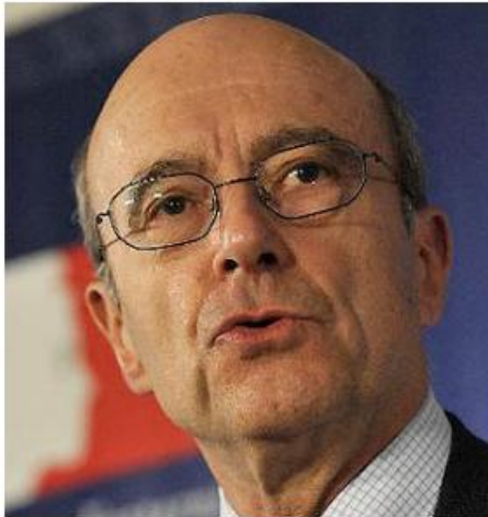
UE amplia medidas de restricción sobre Libia