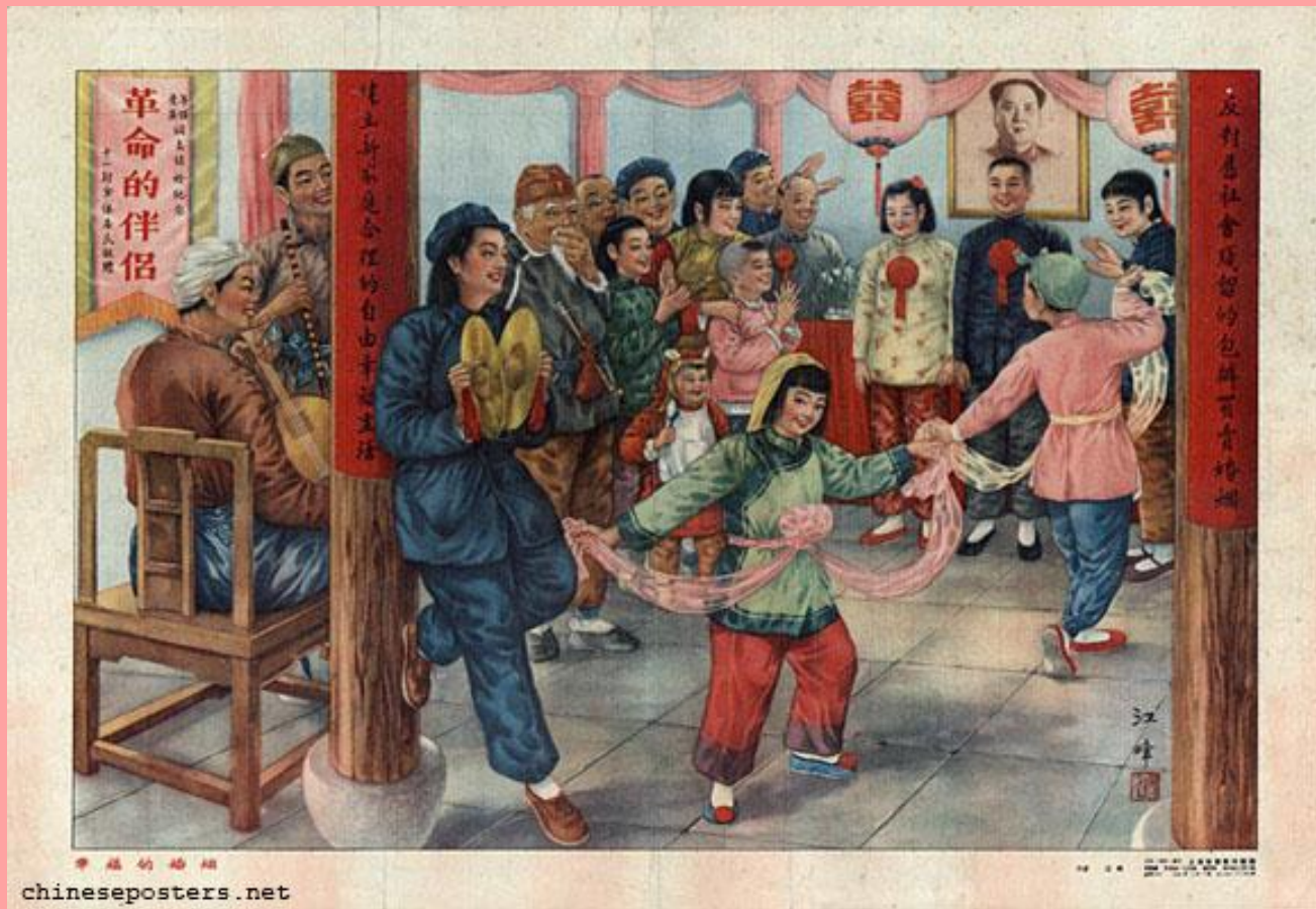
Xingfude hunyin 幸福的婚姻