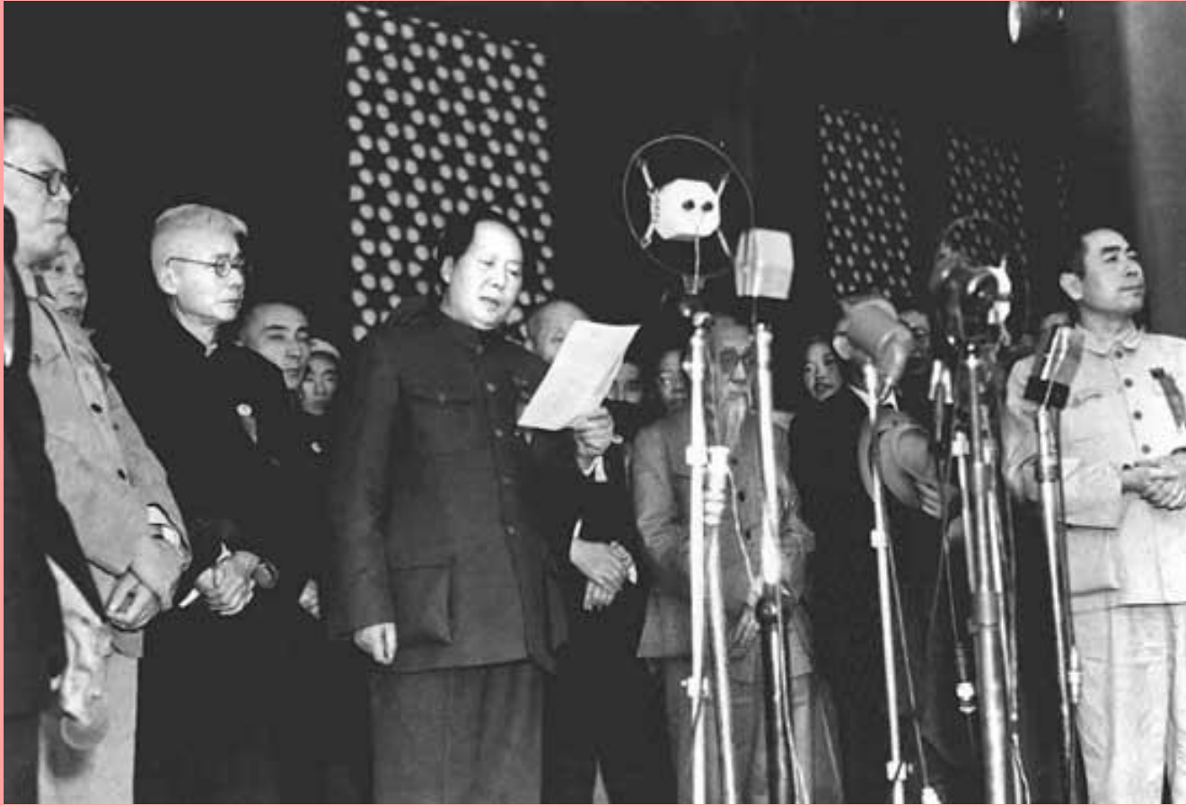
File photo taken on Oct. 1, 1949 shows Chinese leader Mao Zedong reading the Proclamation of the Central People's Government during the founding ceremony of the People's Republic of China in Beijing.