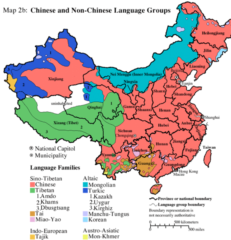
Map 2b: Chinese and Non-Chinese Language Groups