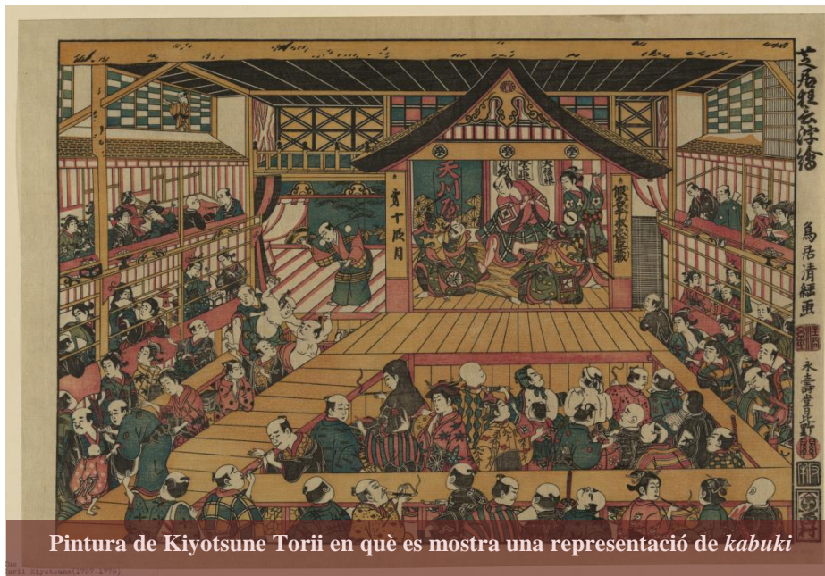
Pintura de Kiyotsune Torii en què es mostra una representació de kabuki

Arribats a aquest punt, cal fer una reflexió a mode de conclusió d'aquest primer apartat. Si es pregunta a un occidental sobre les coses que associa amb el Japó tradicional, amb tota seguretat ens recitarà la llista següent: en l'àmbit de la cultura, els drames nō i kabuki (歌舞), els poemes coneguts com haiku , les xilografies "del món flotant" o ukiyo-e (浮世絵), la cerimònia del te, l'art de disposar les flors o ikebana i els paisatges en miniatura que reflecteixen millor que res l'esperit Zen, la ètica samurai o bushido (武士道)—que comporta una autèntica obsessió pels problemes moral—en arquitectura els sòls recoberts d'estores de palla o tatami , els grans establiments destinats a banys públics, i finalment, en gastronomia, el peix cru i la salsa de soja. Res a objectar a aquesta relació. No obstant això, cal destacar que la gran majoria dels elements esmentats no existien fins a aquesta època, ja que la seva incorporació a la cultura nipona es produeix durant el període Tokugawa (1603-1868) .