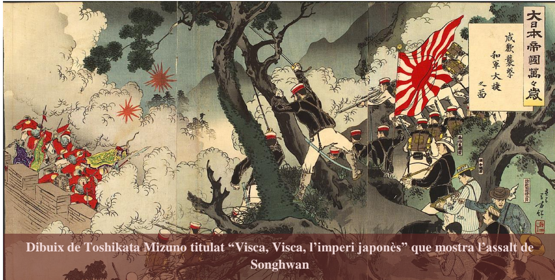
Dibuix de Toshikata Mizuno titulat “Visca, Visca, l'imperi japonès” que mostra l'assalt de Songhwan

consideraven aquestes illes com un regne vassall de la Xina, un fet acceptat pel mateix rei d'aquest arxipèlag. Però el nou govern japonès després d'abolir aquest estatus de regne independent vassall de la Xina, es va annexionar el regne de Ryūkyū—avui en dia, prefectura d'Okinawa—l'any 1879. Llavors va accelerar la seva influència sobre els territoris propers. De fet, després de la victòria sobre la Xina a la primera guerra sinojaponesa (1894-1895) , va prendre possessió dels territoris de l'illa de Taiwan i els seus arxipèlags subjacents.