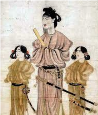
Príncep Shōtoku 聖徳太子 (574-622)

Tanmateix, com s'ha afirmat abans, també es van produir confrontacions entre els dos països com la Batalla de Baekgang de l'any 663. Va ser una batalla entre les forces de Baekje i el seu aliat Yamato, en contra de les forces aliades de Silla i les tropes de la dinastia xinesa Tang, que va enviar 7.000 soldats i 170 vaixells. La batalla va tenir lloc en el curs del riu Geum a Jeollabuk-do i les forces de l'aliança Silla-Tang van obtenir una victòria decisiva que va obligar als japonesos a retirar-se completament.