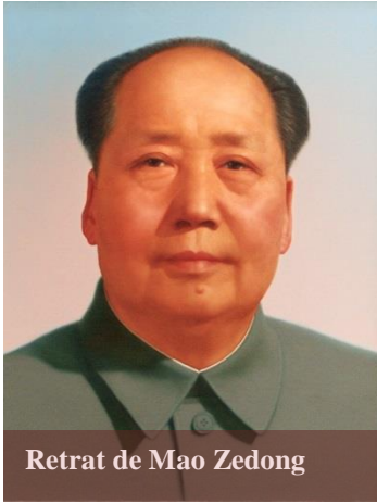
Retrat de Mao Zedong

de superar anys de penúries, va haver de convèncer la gran massa del poble xinès—els camperols—de l'adequació del model socialista per a la Xina, i va haver de superar en una cruenta guerra civil al seu gran rival polític, Chiang Kai-shek (蔣介石), líder del Partit Nacionalista Xinès. Quan el 1949 Mao apareix al centre de Pequín i proclama la victòria del Partit Comunista Xinès (PCX) la seva figura, com a líder polític i militar és pràcticament incontestable. En pocs anys, a més, els elements principals del 'pensament de Mao' es converteixen en hegemònics: en doctrina política fora de discussió. El marge per al debat intel·lectual és limitat amb l'excepció d'alguns episodis concrets en què el propi Mao obre les portes a