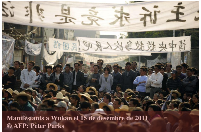
Manifestants a Wukan el 15 de desembre de 2011

La proliferació dels 'incidents de masses' són l'exemple més clar del problema d'estabilitat interna al qual fa front la Xina. Cal entendre bé quina és l'arrel d'aquestes expressions públiques de descontentament. No hi ha atacs directes al sistema en el seu conjunt, sinó a episodis i elements concrets. Per exemple,