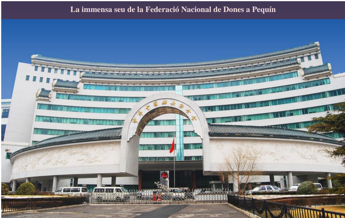
La immensa seu de la Federació Nacional de Dones a Pequín

Recentment la representativitat i funcionalitat de les organitzacions de masses ha estat posada en qüestió, sobretot arrel de l'aparició per tota la Xina de petites entitats que es posicionen al marge de les organitzacions de masses (i que per tant poden no estar sota el control del PCX o de l'estat), i que, podríem dir, són el més semblant que la Xina té a les organitzacions no governamentals (ONG). L'estatus legals d'aquestes organitzacions és complex i dispers. Per a poder constituir una organització no governamental, sovint conegudes en xinès com organitzacions populars (民间组织) cal registrar-se al Ministeri d'Afers Civils. Per fer-ho necessiten el suport institucional d'un organisme públic (d'una agència estatal habitualment) que sigui rellevant en l'àmbit en el qual volen desenvolupar la seva activitat. Això vol dir que, una organització que vulgui treballar en la prevenció del VIH, cal que obtingui el permís d'una institució en l'àmbit de la salut, com per exemple el Ministeri de Sanitat. Si no l'obté, no podrà obtenir la llicència. A més a més, es marca el límit d'una organització per àmbit temàtic en cada nivell d'organització territorial. Això vol dir que, per exemple, a la ciutat de Xangai només hi podrà haver una associació de defensa dels animals. L'any 2011, el nombre total d'organitzacions populars registrades a la Xina era de 462.000. La importància d'aquestes organitzacions rau en el fet que,