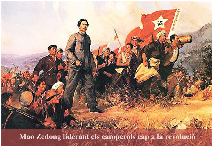
Mao Zedong liderant els camperols cap a la revolució

El PCX es va fundar a Xangai l'any 1921 gràcies a l'assistència del Komintern, la branca de promoció internacional del Partit Comunista de la URSS. Malgrat que en aparença el PCX sigui una entitat inamovible, la realitat és que el partit avui en dia és molt diferent del que es va fundar els anys 20 i té ben poc a veure, també, amb el partit que Mao Zedong va liderar durant tres dècades. En l'actualitat, amb més de 80 milions d'afiliats , el PCX és l'organització política més gran del món i, només el Partit dels Treballadors de Corea del Nord ha tingut el